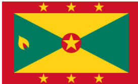
La bandera del Granada

La bandera de Granada tiene siete estrellas esos representan las parroquias. La estrella media representa la parroquia de St. George, el capital de la ciudad. Los colores representan la identidad Africano.