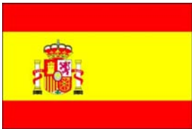
La bandera del España

La bandera de España es rojo y amarillo. La bandera tiene la capa de brazos de España. La capa de brazos es para el uso real. El rojo y amarillo también representan la familia real. Granada está representado por la fruta en el fondo de la capa de brazos.